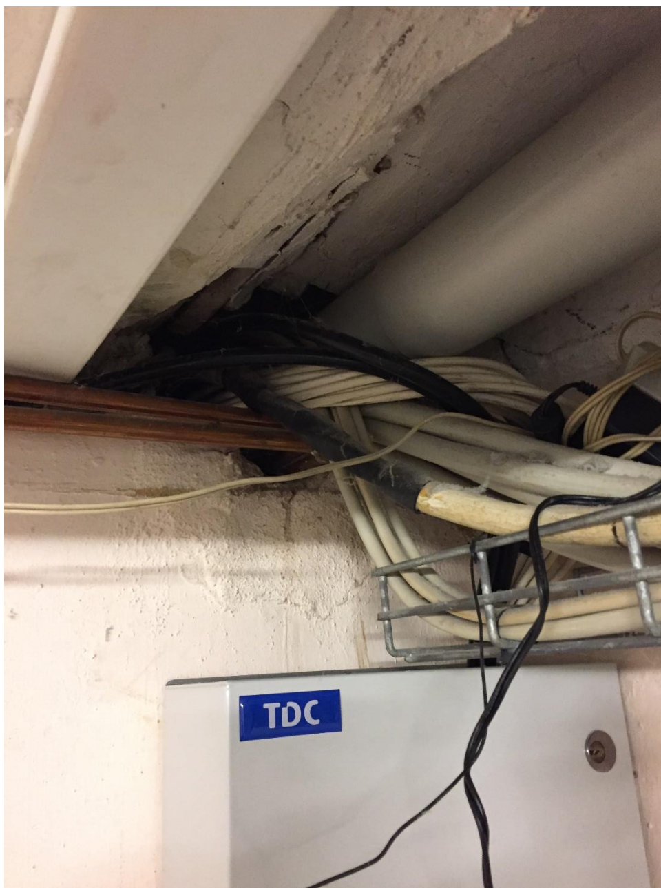
Figur 1: Manglende brandtætning ved installationsgennemføring i kælder

Herunder ses aktuelle eksempler på manglende brandtætning omkring gennemføringer i brandadskillende bygningsdele, manglende brandmæssig adskillelse mellem lokaler i det aktuelle byggeri.