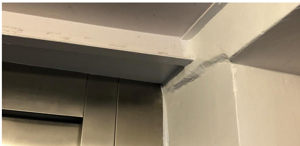
Figur 5: Ubeskyttet stålbjælke. Kravet til brandmodstandsevnen er 60 minutter i henhold til BR95.

Dette betyder at stålbjælke i kælder skal brandbeskyttes til BS-bygningsdel 60 medmindre dennes bæreevne kan undlades i brandlastsituationen. Derudover skal det ligeledes tilsikres at det ubeskyttet bjælkelag i kælderen ikke er bærende, eller skal dette sikres som en BS-bygningsdel 60, eventuelt med et brandbeskyttelsessystem klasse K 2 60 / A2-s1,d0.