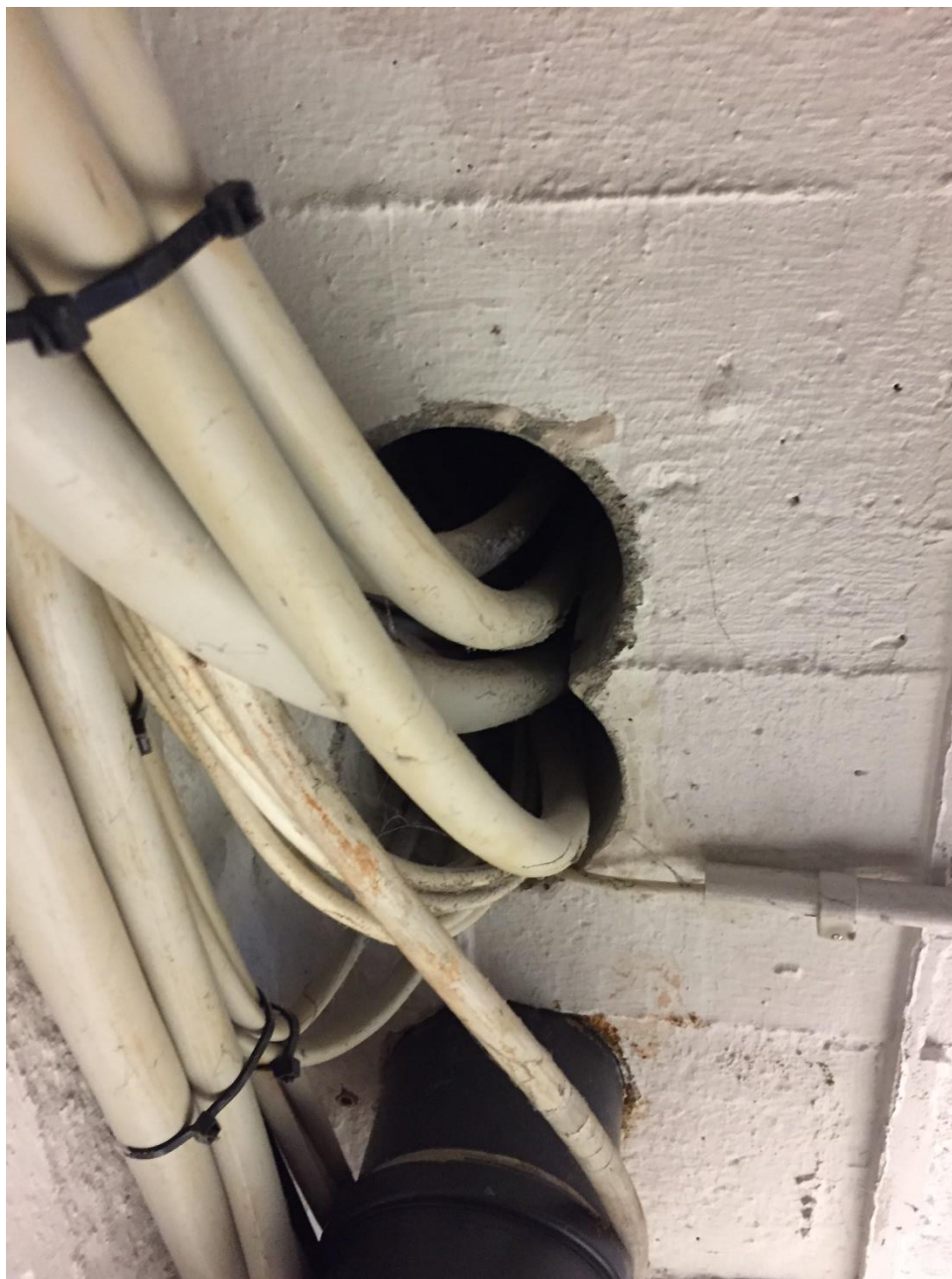
Figur 3: Manglende brandsikring og brandtætning ved faldstammer/afløb i kælder.