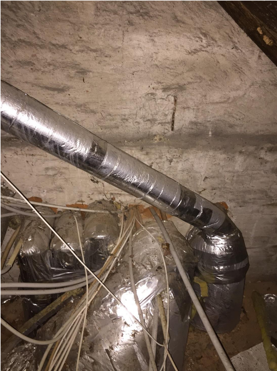
Figur 2: Manglende brandtætning ved installationsgennemføring i kælder